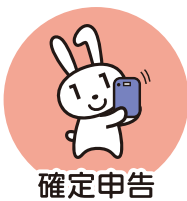
確定申告 (2024年度より)