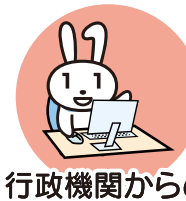
行政機関からの お知らせ・各種証明書